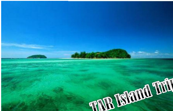
TAR Island Trip